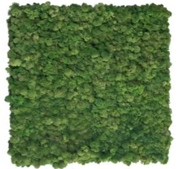
Tegel 600 x 600 mm Zonder randafwerking, makkelijk koppelbaar