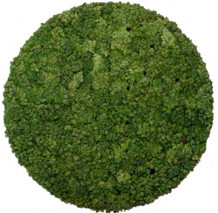
Cirkel diameter 1200 mm Met randafwerking (Bestaat uit vier delen, die aan elkaar gekoppeld dienen te worden)