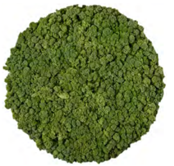
Cirkel diameter 600 mm Met randafwerking